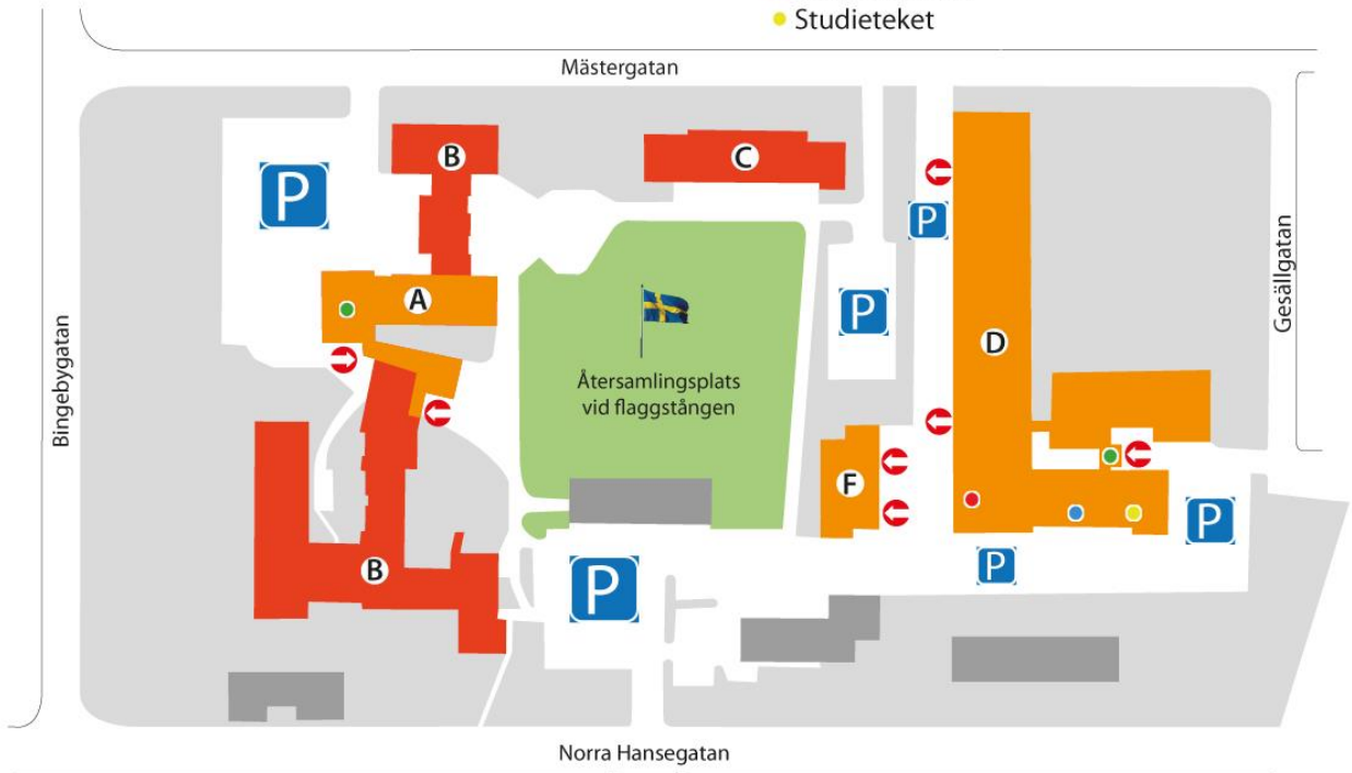
Orienteringskartor för våra lokaler på Gesällgatan 7