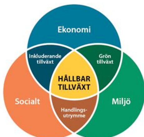
Figur 3. Hållbar tillväxt består av tre dimensioner som alla behöver beaktas

Att arbeta för ökad hållbarhet är en nödvändighet av flera skäl. Förutom att det är en överlevnadsfråga för mänskligheten är det också en överlevnadsfråga för företag. Kunder och konsumenter ställer allt högre krav på att företag ska kunna visa att och hur de arbetar med hållbarhet, ekologiskt, socialt och ekonomiskt. Många undersökningar visar dessutom att det är ekonomiskt lönsamt. Att öka hållbarheten handlar om att ständigt göra förflyttningar genom de beslut som tas – både av de enskilda företagen och av myndigheter och organisationer. Inte minst är det viktigt att en förflyttning mot ökad hållbarhet är ett kriterium i samband med bedömning av ansökningar om företagsstöd och projekt.