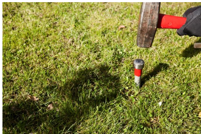
Markering av gränspunkter i tidigt skede.

Vid utstakningen används fastighetsgränser som utgångspunkter i första hand, varför det är nödvändigt att återfinna dessa i fält. Återfinns inte gränsmarkeringarna kan det bli nödvändigt att begära hjälp från Lantmäteriet för att säkerställa var en gräns går. Kostnad för detta ligger utanför kostnaden för utstakningen. För att undvika problem med gränsmarkeringar som saknas eller är oklara bör byggherren i tidigt skede leta upp och markera gränsmarkeringarna.