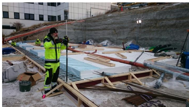
Lägeskontroll utförs när formen är satt.

Det är byggherren som ansvarar för att byggnaden är uppförd på rätt plats enligt givet bygglov och byggnadsnämndens uppgift är att se till att byggherren uppfyller sina åtaganden.