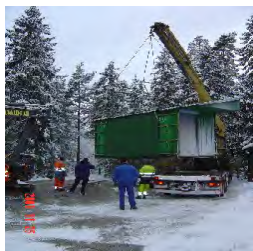
Här lyfts ena halvan av den byggnad, vilken innehåller den nya membrantechnik som renar Åminnebornas vatten på plats.

Några nya vattenledningar från Slite till Åminne har man inte gjort eftersom vattendomen, som reglerar hur mycket vatten man får ta ut, inte skulle räcka till. I stället valde Tekniska förvaltningen att för Åminnes del använda en renings teknik kallad membrantechnik. Vattnet renas lokalt på plats i Åminne genom avhärdning med Nanomembran. Därefter höjs pH till 11,2 bor tas bort genom omvänd osmos. Sedan sänks pH till ca 8,4, genom svavelsyra dosering och inblandning av 20-25% råvatten. (Råvattnet blandas in för att få bättre mineral halt i dricksvattnet) Därefter genomgår vattnet desinfektion, varpå det är ett godkänt dricksvatten.