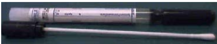
P3. Art.nr 10350. Provtagningsset (Copan) för sårodling, svalgodling, faecesodling mm.