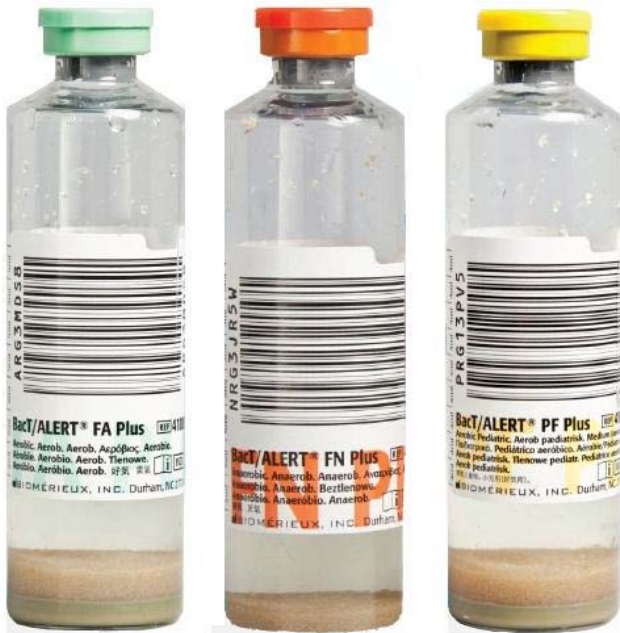
P1. Blododlingsflaskor, från vänster: aerob flaska, anaerob flaska, barnflaska.