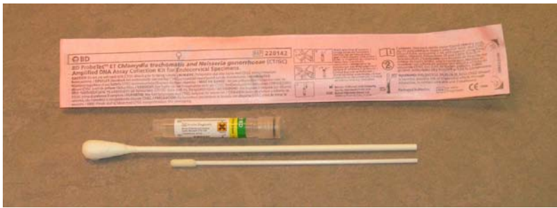
P9. Provtagningsset för Chlamydia: cervix, rectum och svalg (rosa förpackning).