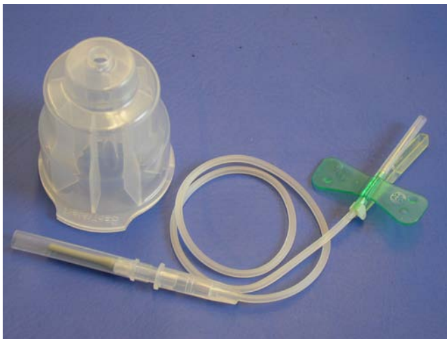
P2. Provtagningsset, blododling.