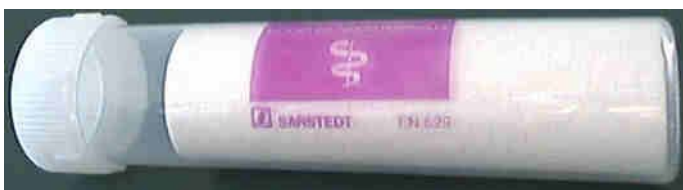
P13. Art. nr 11160. Transporthylsa för Vacutainerrör.