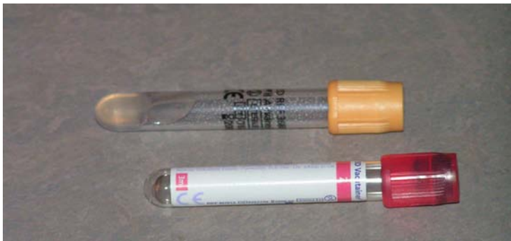
P12. Art.nr 10911. Vacutainerrör (gul kork) med gel för blod till serologi. Art.nr 11663. Vacutainerrör (röd kork) utan gel för blod till serologi.