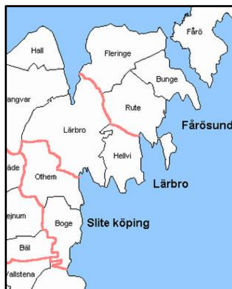
Figur 1: Socknar på norra Gotland