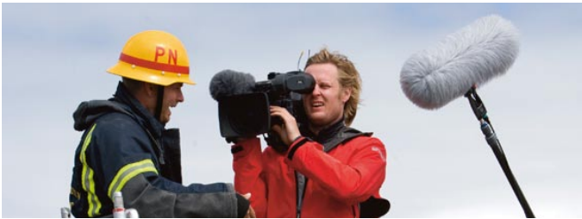
Inspelning av SOS Gute.