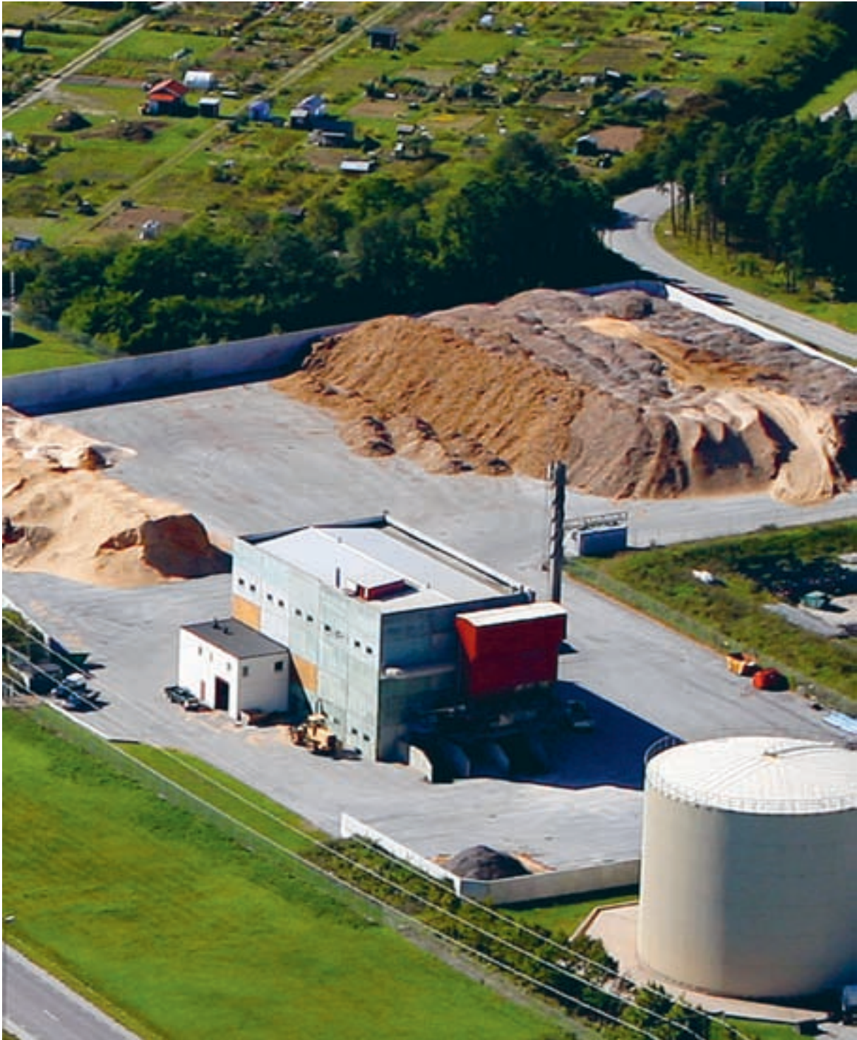
SKRUBBS VÄRMEVERK

Ett av vår tid största problem är samhällets beroende av olja och kol. De största hoten som jorden står inför är den klimatpåverkan som orsakas av höjda halter av växthusgaser i atmosfären. Dessa orsakas till stor del av kol- och oljeeldning till uppvärmning. Transporter med fossila bränslen som drivmedel har orsakat också mycket stor påverkan på miljön. En stor del av utsläppen av fossil koldioxid kommer från hushållens verksamheter. Klimatpåverkan är ett av de tydligaste exemplen på global spridning, problemen uppstår ofta långt från utsläppen.