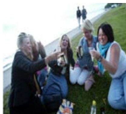
Picknick nära havet i Visby