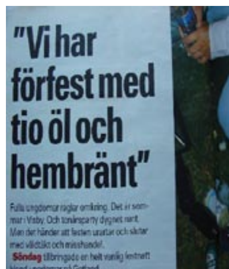
Aftonbladet Söndag skriver om den stökiga visbysommaren (2003-08-03)